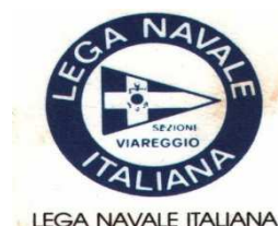
LEGA NAVALE ITALIANA