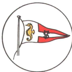
SOC. VELICA VIAREGGINA